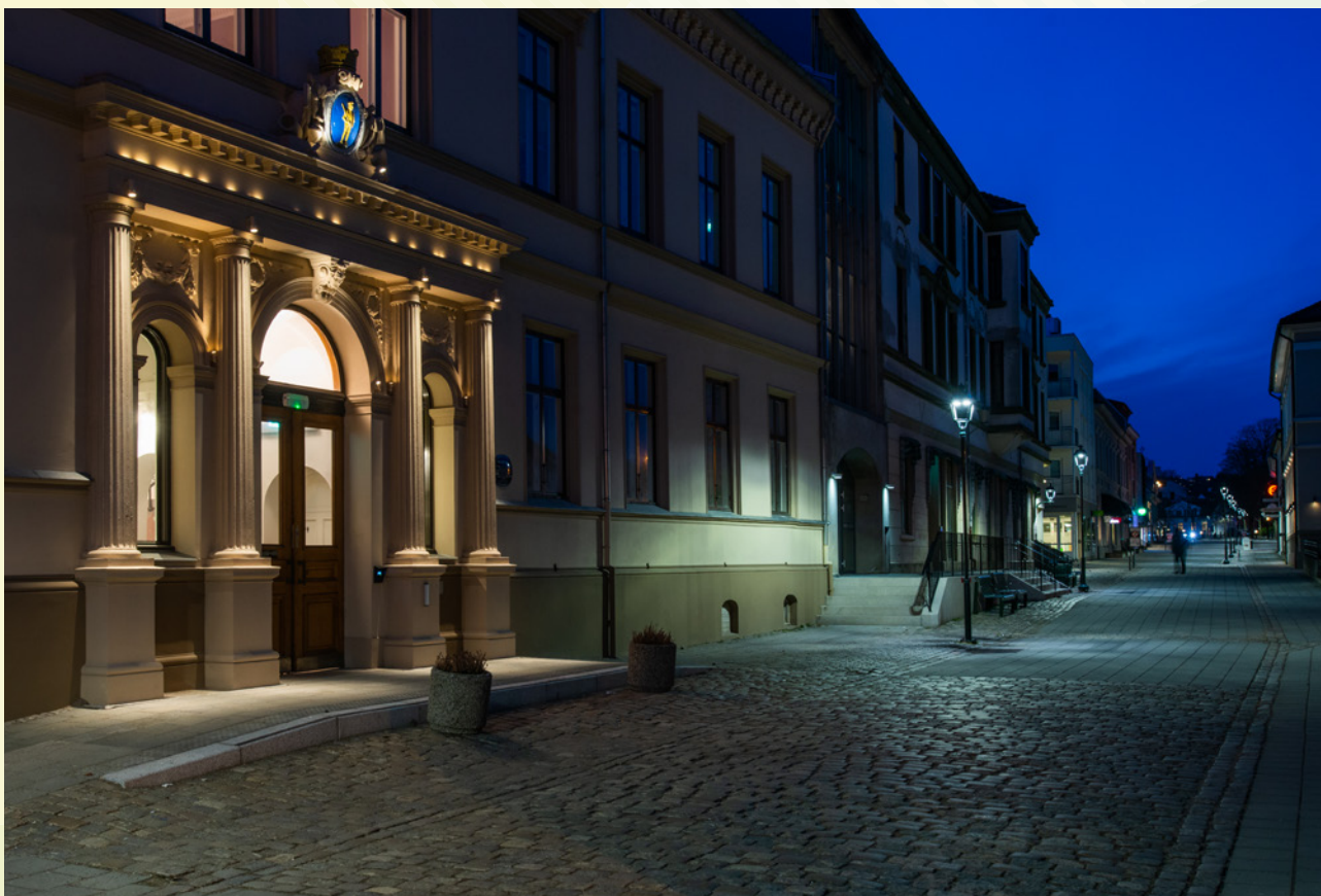
Rådhuset og Storgata.

På grunn av det lave rentenivået i dagens marked reinvesteres ikke renteutbetalinger og forfalte obligasjoner i hold til forfall-porteføljen. Dette fører til at andelen av obligasjoner