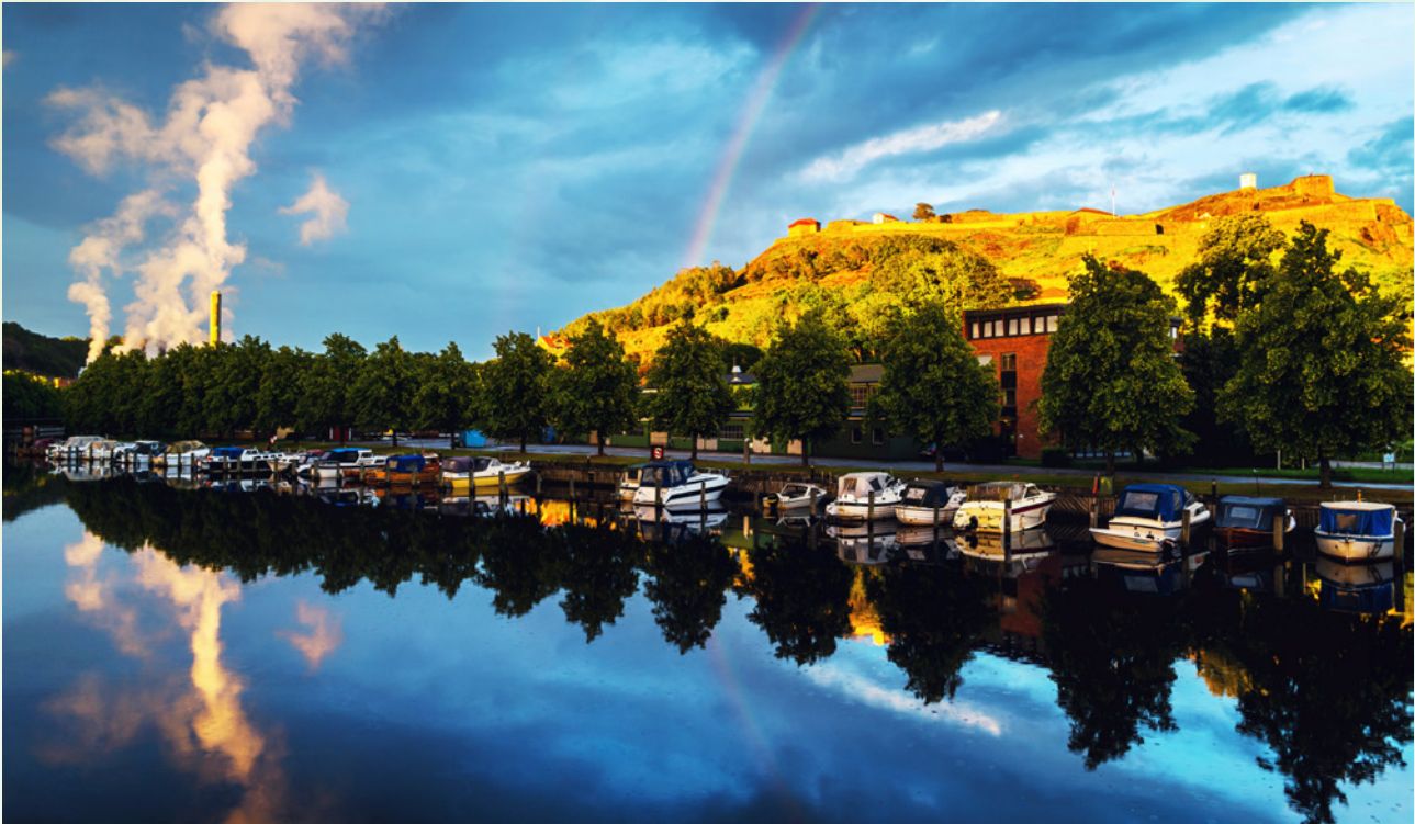
Tista med festningen og Norske Skog Saugbrugs i bakgrunnen.

som bokføres til amortisert kost (dvs. uten kursgevinst/-tap) faller. Denne aktivaklassen har en stabiliserende effekt på pensjonskassens avkastning over tid, og gir også gunstige effekter i solvenskapitaldekningen i form av lavere forventet risiko i porteføljen. HKP ønsker derfor å opprettholde andelen av obligasjoner som holdes til forfall, men det er vanskelig å finne attraktive investeringer i dagens rentemarked.