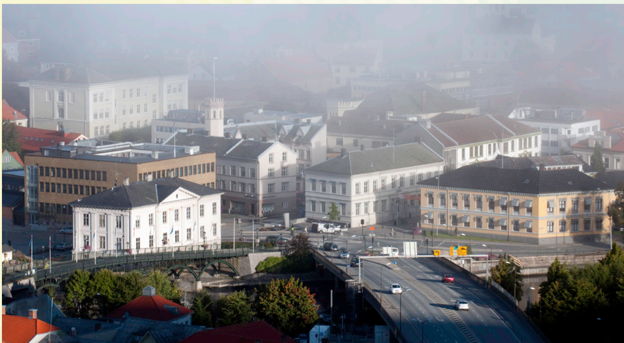
Wiels Plass og rådhuset sett fra Fredriksten festning.